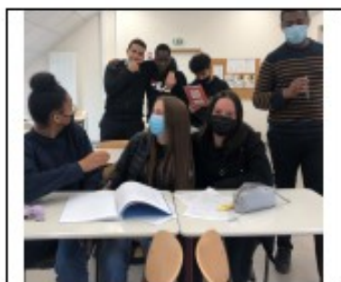
L'atelier, "CLUB JOURNAL"

Il s'agit donc d'un travail précieux qui gagnerait à être amélioré. Nous avons besoin de vos avis et de vos suggestions.