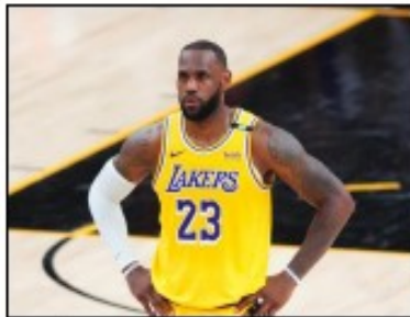
Lebron James.