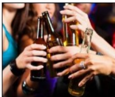
Addiction, des sources nombreuses...

Dans cette rubrique, je compte publier des textes sur les différents sujets qui touchent à l'adolescence. Âgée de 16ans, je pense avoir le droit à la parole sur les sujets qui me concernent ou qui concernent les personnes de mon âge. Parmi les nombreux sujets qui touchent les adolescents, j'ai choisi d'aborder ici, la question des addictions et celle relative au stress à l'école. Le but est qu'après avoir posé, à partir de ma propre expérience,