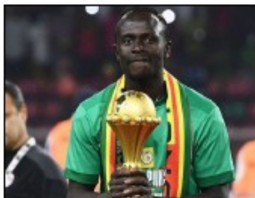
Sadio Mané