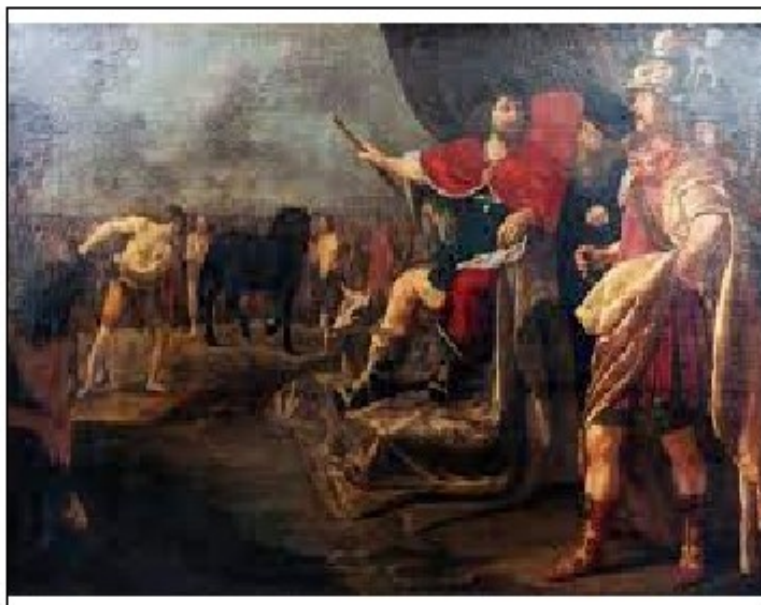
© Sertorius et sa biche. Superprof.fr

"Ses exploits sont le fait d'une biche sacrée qui fait l'intermédiaire entre Dieu et lui..."