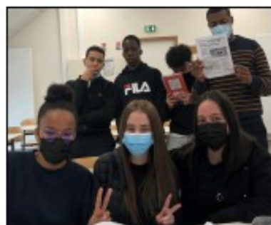
L'atelier " Club Journal"

Comme le veut notre slogan, Accessible ( traduit en plusieurs langues), ce journal est le vôtre. Des contacts sont fournis, vous pouvez, que vous soyez enseignants ou élèves, nous rejoindre pour mener avec nous ce