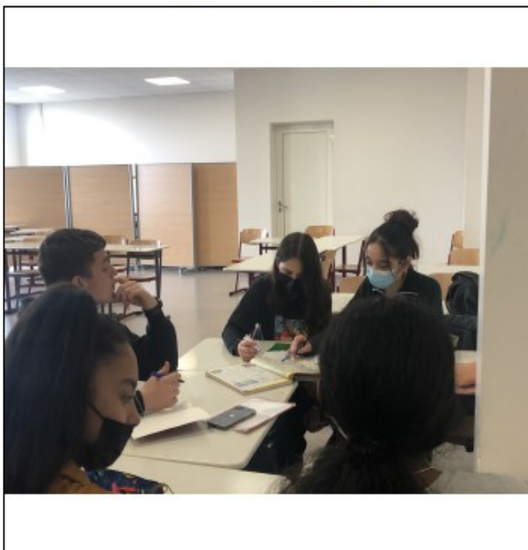
La Seconde B au travail...

Ils s'entraînent « assidûment » pour pouvoir remporter le concours. Ils sont assez confiants comme nous pouvons le voir avec leur estimation de réussite qui est de l'ordre de 80% . La seconde B ne craint aucun adversaire. Elle se dit disposée à affronter l'ensemble de ses adversaires avec sérénité. La Seconde B se sent particulièrement à l'aise en SVT et en Mathématiques. En revanche, elle redoute la Chimie et le Français. Les représentants interrogés se disent « motivés, investis » et « confiants », d'où un slogan, pour le moins, très affirmatif : « Les B au sommet ».