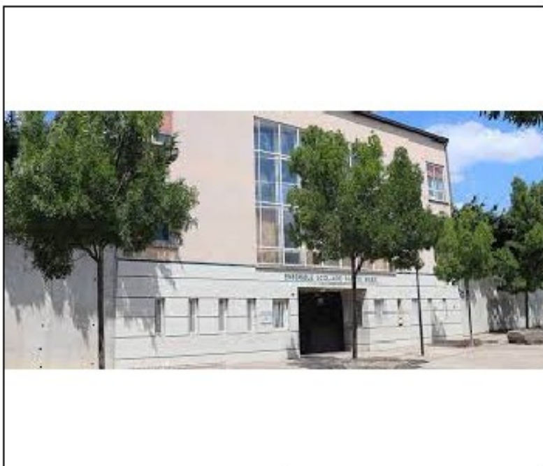
Façade de l'établissement Sainte-Marie.