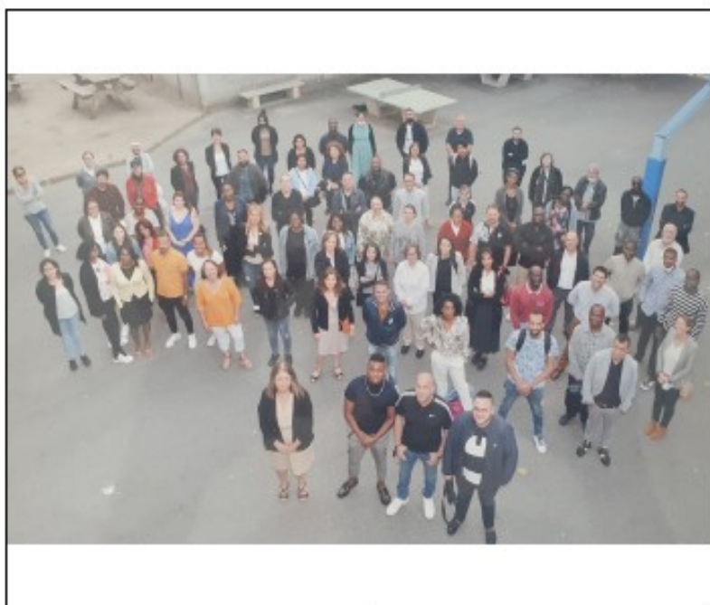
Ensemble Sainte-Marie, 2021 / 2022