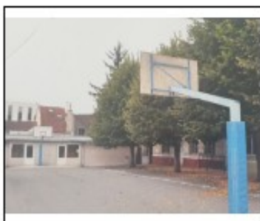
Cour collège, Sainte-Marie