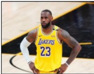
LeBron James.

Enfin, 2022 étant une année singulière, la guerre qui éclata en Russie eut un impact sur le sport mondial.