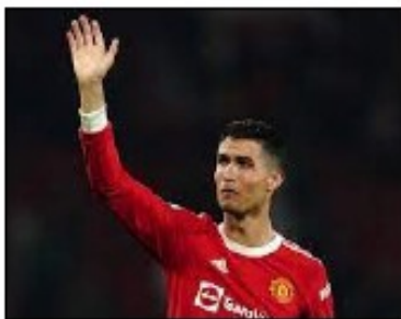
Cristiano Ronaldo