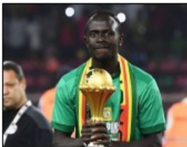
Sadio Mané