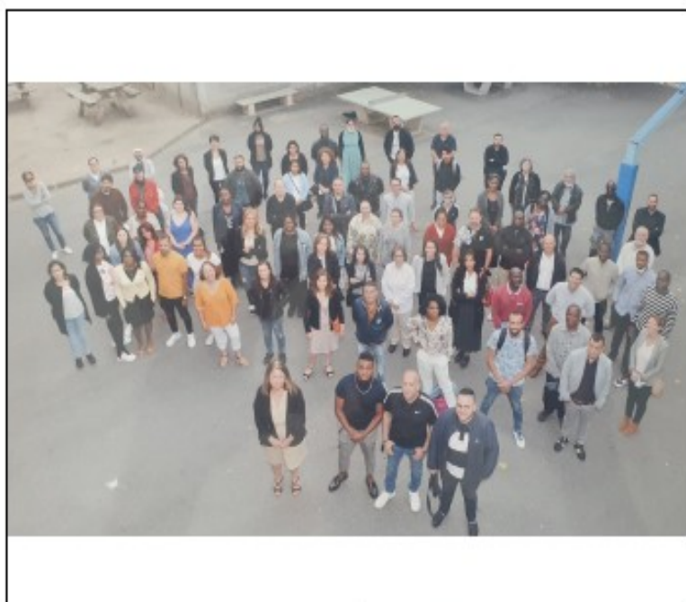
Ensemble Sainte-Marie, 2021 / 2022