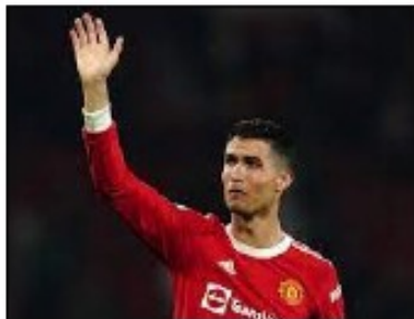
Cristiano Ronaldo