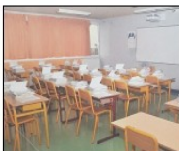
Intérieur d'une salle de classe, Sainte-Marie